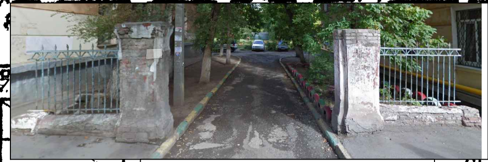
1.Ремонт штукатурки колонн с последующей покраской. 2.Ремонт ограждения с покраской.