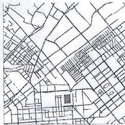
границы испрашиваемой территории