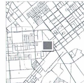
границы испрашиваемой территории