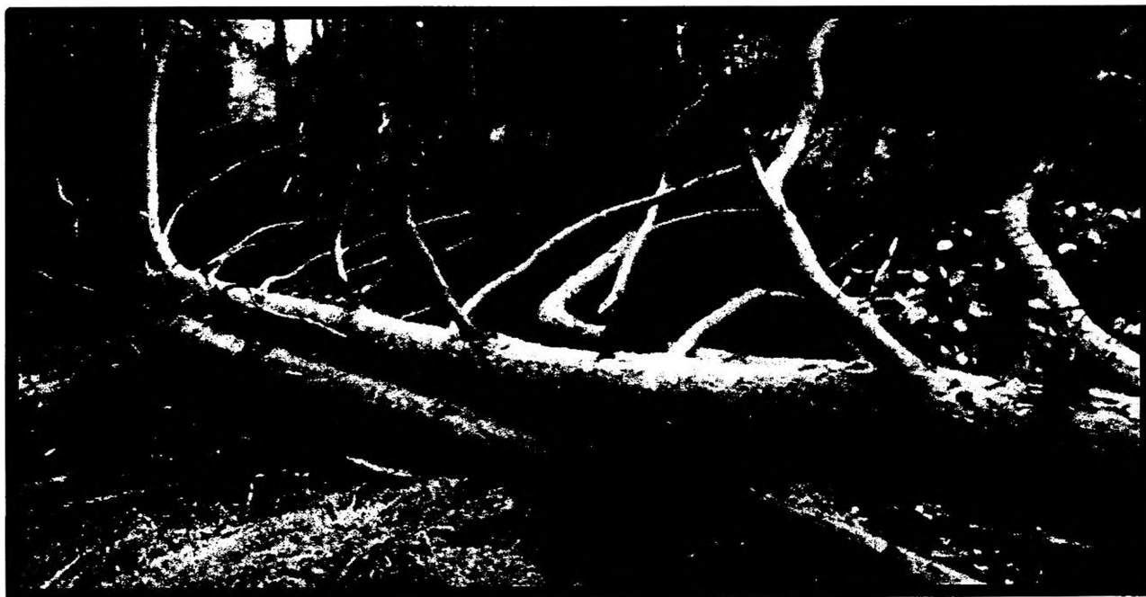
Лежащее на поверхности земли ветровальное дерево, не имеющее признаков отмирания. Не является валежником

Кроме того, необходимо обратить внимание, что деревья, которые лежат на земле, но не имеют признаков естественного отмирания (имеют зеленую листву или хвою), определять как «мертвые» не допускается (смотри изображение № 5).