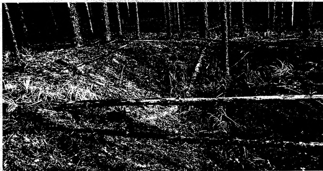
Изображение № 1 Валежник

Примеры валежника (смотри изображения №№ 1,2,3).