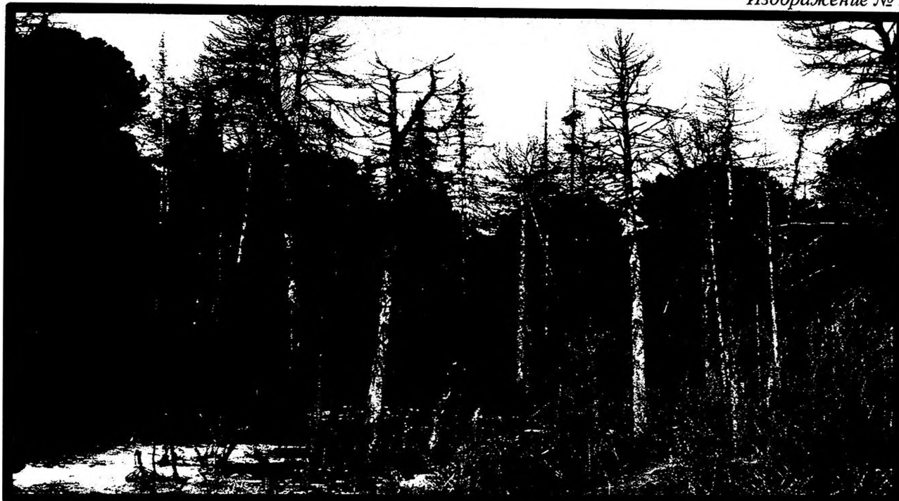
Изображение № 4 Сухостойное дерево. Не является валежником Изображение № 5

Кроме того, необходимо обратить внимание, что деревья, которые лежат на земле, но не имеют признаков естественного отмирания (имеют зеленую листву или хвою), определять как «мертвые» не допускается (смотри изображение № 5).