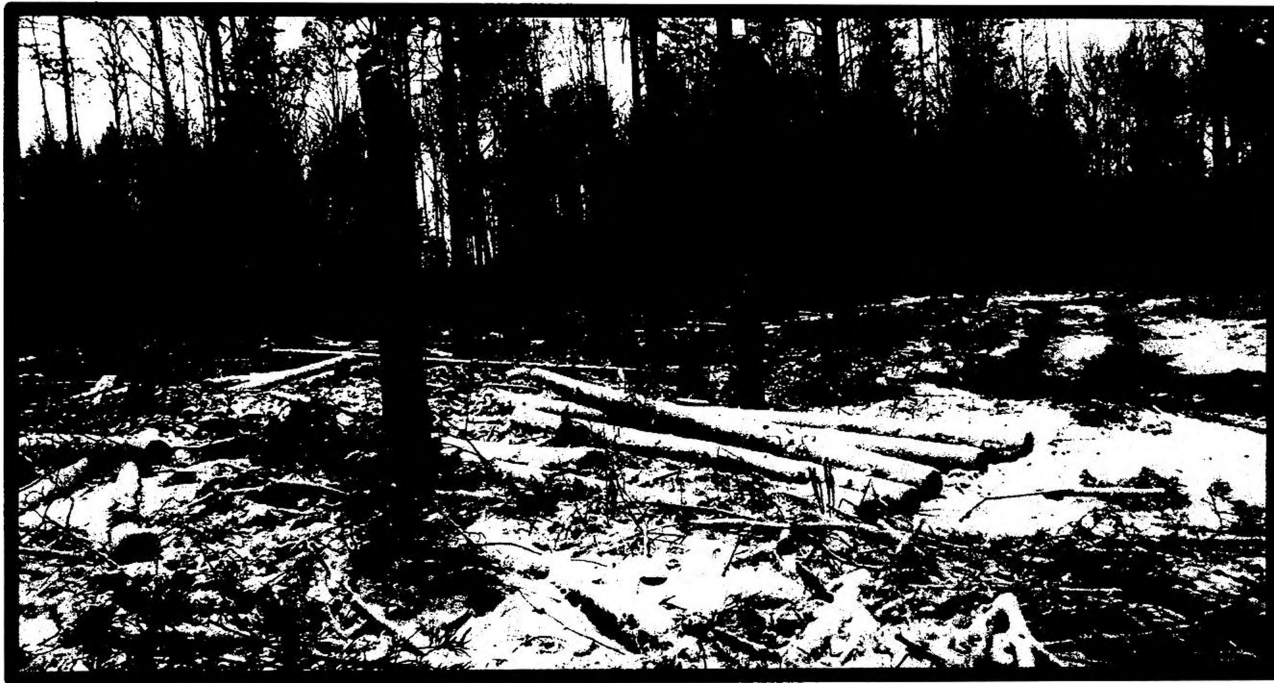
Изображение № 7 Брошенная древесина вдоль лесовозных дорог. Не является валежником