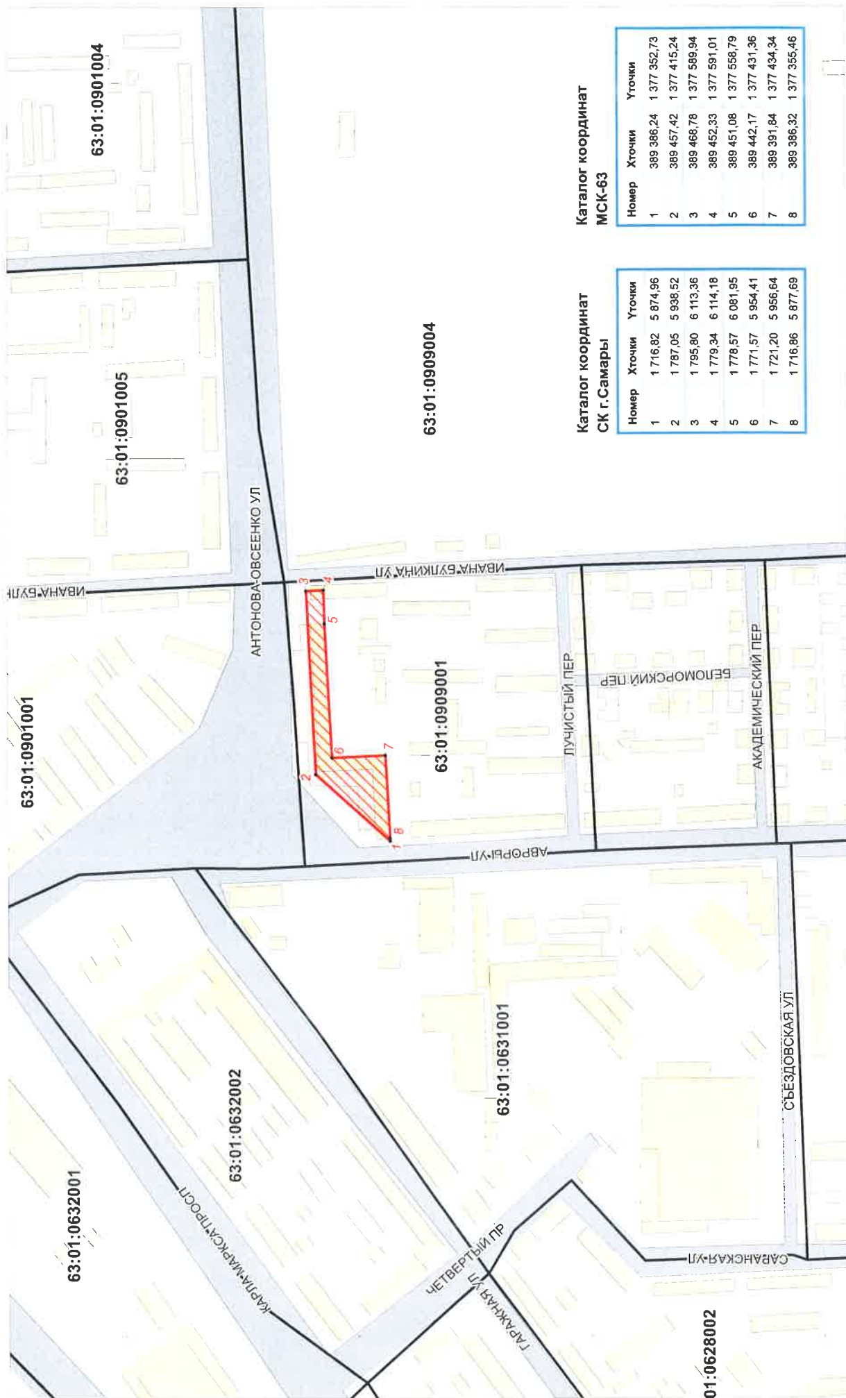
Каталог координат СК г. Самары